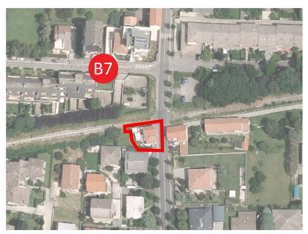
STRALCIO AMBITO B7